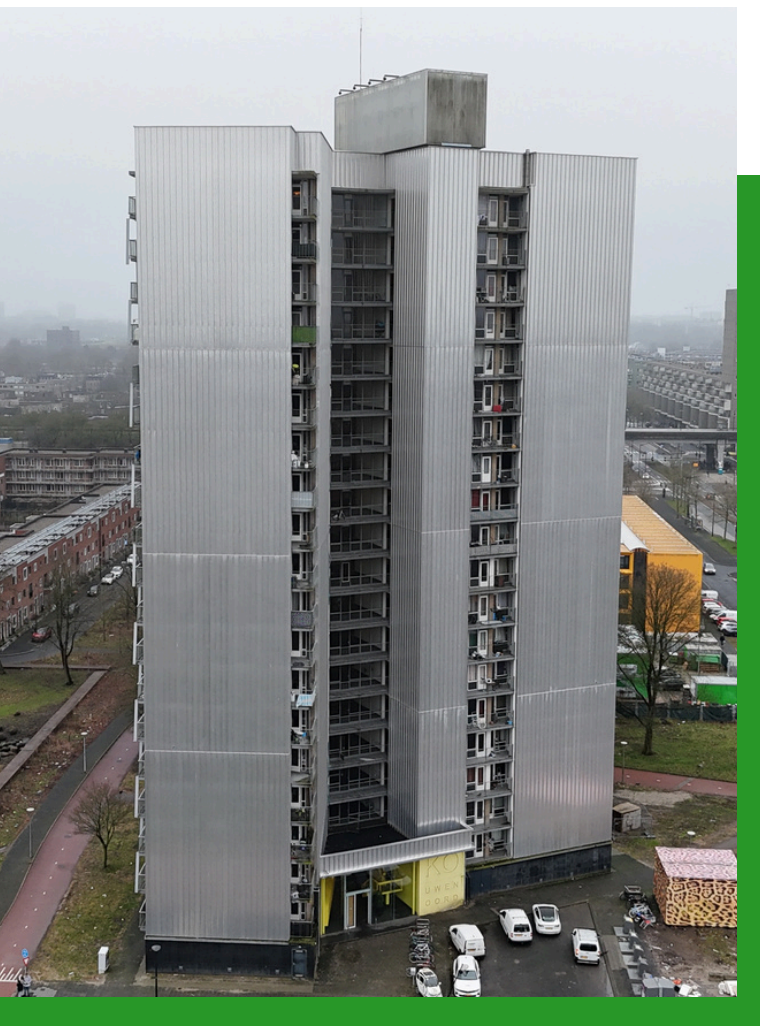
*Eén van de vier K-torens in Amsterdam Zuidoost