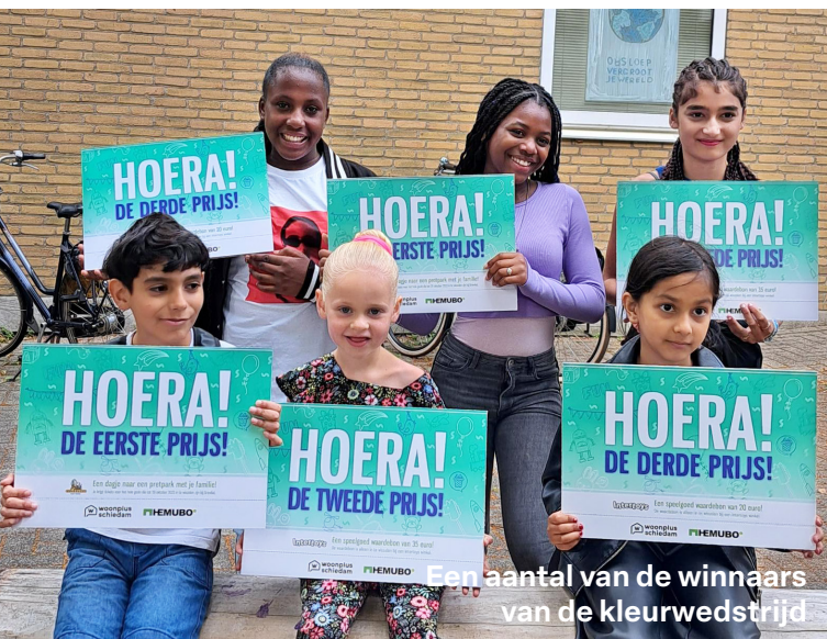
Een aantal van de winnaars van de kleurwedstrijd

Wij vinden het belangrijk dat we de hele buurt meenemen. Als we deze verduurzamingsslag maken, denken we meteen na over hoe we de sociale cohesie in de buurt kunnen verbeteren. Deze viering doen we dus ook met de buurt en we nemen hierin onder meer de basisscholen mee die midden in de wijk liggen. Hemubo heeft een kleurplaatwedstrijd uitgeschreven en voor de kinderen en hun families waren er mooie prijzen te winnen, bijvoorbeeld een bezoek aan een pretpark.