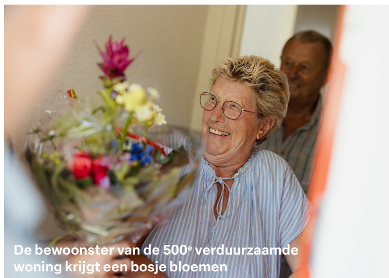
De bewoonster van de 500 e verduurzaamde woning krijgt een bosje bloemen