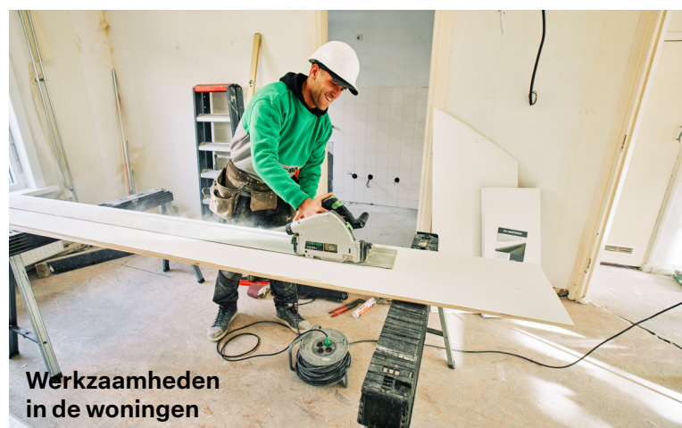
Werkzaamheden in de woningen