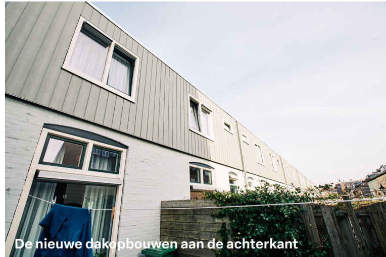
De nieuwe dakopbouwen aan de achterkant

we uiteraard mee naar mogelijke volgende projecten. Wij gaan met een goed gevoel werken aan de volgende fasen in de Indische Buurt, samen met Hemubo zijn wij een heel goed team gebleken. Dus ik zie een mooie toekomst."