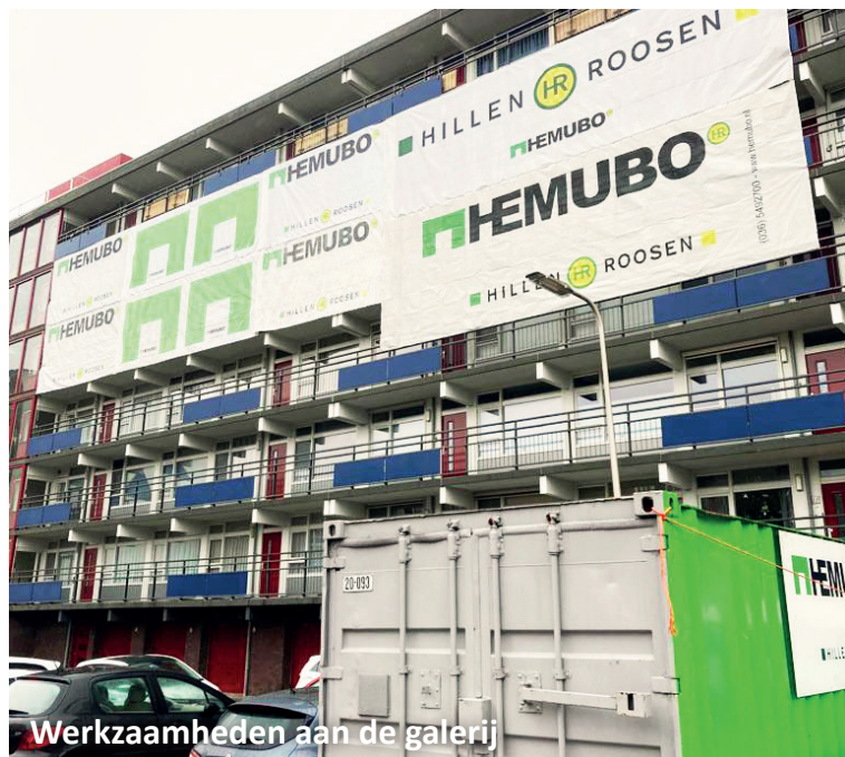
Werkzaamheden aan de galerij