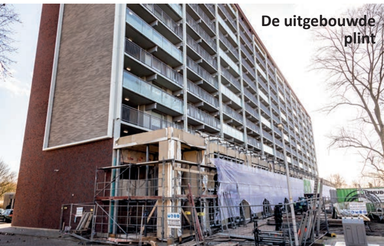
De uitgebouwde plint

en scooters. We hebben het glas voor de helft transparant gelaten. Hierdoor is er zicht in de fietsenbergingen, maar ook zicht naar buiten, waardoor de ‘ogen’ van bewoners de achterzijde van de flat in de gaten kunnen houden.