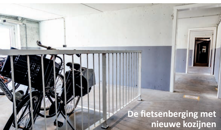
De fietsenberging met nieuwe kozijnen