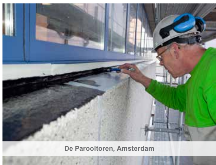
De Parooltoren, Amsterdam