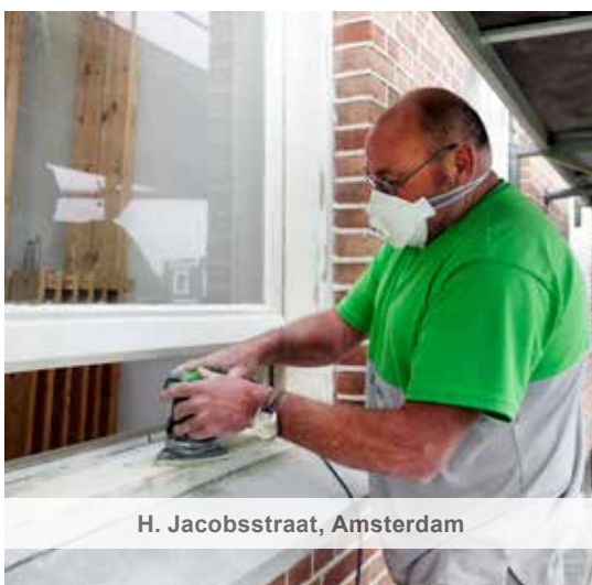
H. Jacobsstraat, Amsterdam